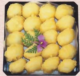
706 天ぷら万十重詰 2,100 円 (24×24cm)