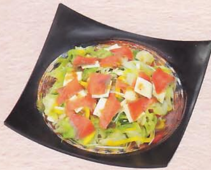
702 スモークサーモンとチーズのサラダ 3,150 円 (26×26cm)