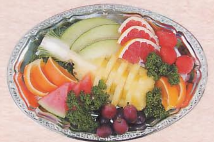
709 フルーツ盛 2,100 円 (38×27cm)