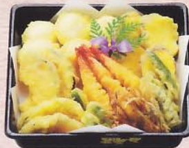
705 天ぷら重詰 2,100 円 (24×24cm)