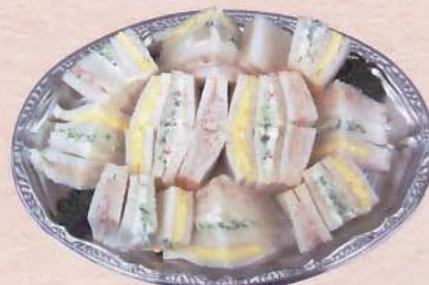
711 サンドイッチ 1,785 円 (38×27cm)