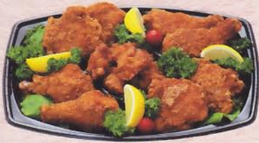
315 チキンパーティーセット 2,625 円 (30×21cm)

※写真は調理例です。季節によりお料理の内容が変わります。 ※ご用途・ご予算に応じてお作りいたします。ご相談ください。 ●( )内の数字は器のサイズです。