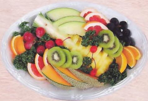
707 フルーツ盛 3,150 円 (46×32cm)