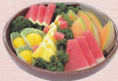
708 フルーツ・デザート皿 3,150 円 (28cm)