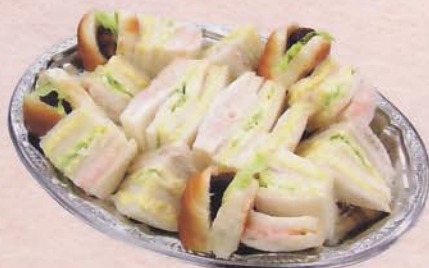
710 サンドイッチ 2,415 円 (38×27cm)