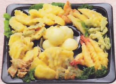
704 天ぷら皿盛 3,150 円 (34×34cm)